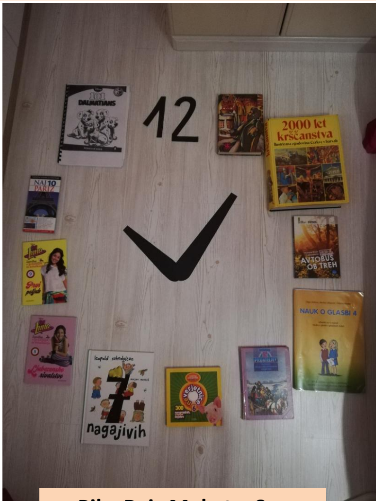
Pika Rejc Mekota, 8. c

Knjiga je telovadba za možgane in tudi telo!