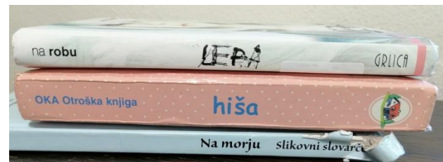
Zala Birsa, 8. c