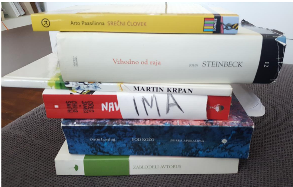
Iztok Stojanovič, 8. c