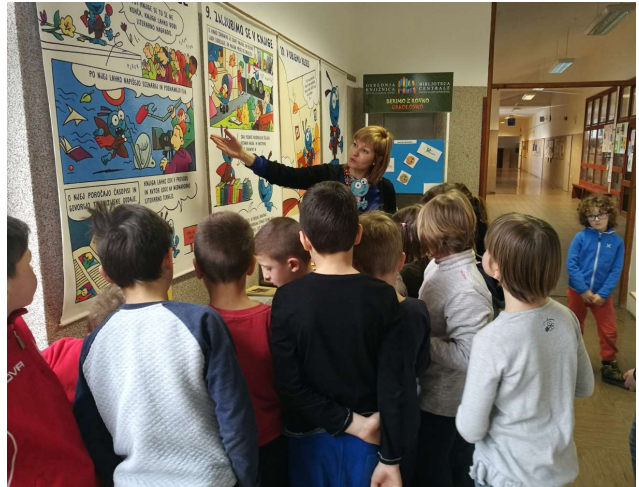
Učenci so z zanimanjem prisluhnili zgodbi o knjigi.

V času med 5. in 16. marcem smo na šoli gostili potujočo razstavo POT KNJIGE, OD AVTORJA DO BRALCA . Zanimivo in poučno pot, predstavljeno na plakatih, smo naredili še bolj privlačno in nazorno z razstavo in poučnim vodenim ogledom po njej. V štirinajstih dneh so si jo ogledali vrščevski otroci, učenci naše šole in OŠ Pier Paolo Vergerio il Vecchio.