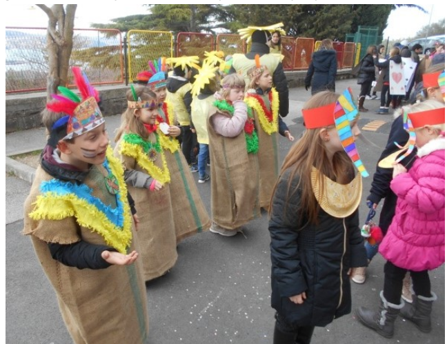
Pripravljamo se na povorko.

Po poti smo prepevali pustne pesmi, ropotali z različnimi zvočili in preganjali zimo. Obiskali smo otroke italijanskega vrtca Delfino Blu ter se napotili pred gasilski dom, kjer smo nadaljevali z rajanjem.