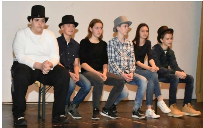
Utrinek s prireditve Kultura združuje.

S izbranimi Prešernovimi ljubezenskimi pesmimi smo nastopili tudi na prireditvi Kultura združuje , ki je potekala 17. februarja. Naša ravnateljica je bila častna govornica na prireditvi, ki že 8 let povezuje Škofije, sosednje Milje in Hrvatine.