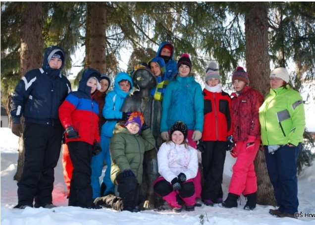
V Kekčevi deželi ...

Peto- in šestošolci smo se v času med 26. 2. in 2. 3. mudili v Kranjski Gori, kjer smo bili v zimski šoli v naravi. Letos smo imeli prav prijetno smuko, saj je bilo snega več kot dovolj, počeli pa smo tudi marsikaj poučnega, zanimivega in zabavnega.