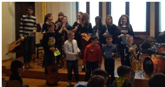
Nastop hrvatskih učencev, ki obiskujejo glasbeno šolo.

7. marca so imeli učenci 1. triade kulturni dan - kulturne ustanove . V GLASBENI ŠOLI so nam pripravili krajši koncert, na katerem so nastopili učenci naše šole. Po koncertu smo si ogledali še druge kulturne ustanove in kulturno dediščino Kopa.