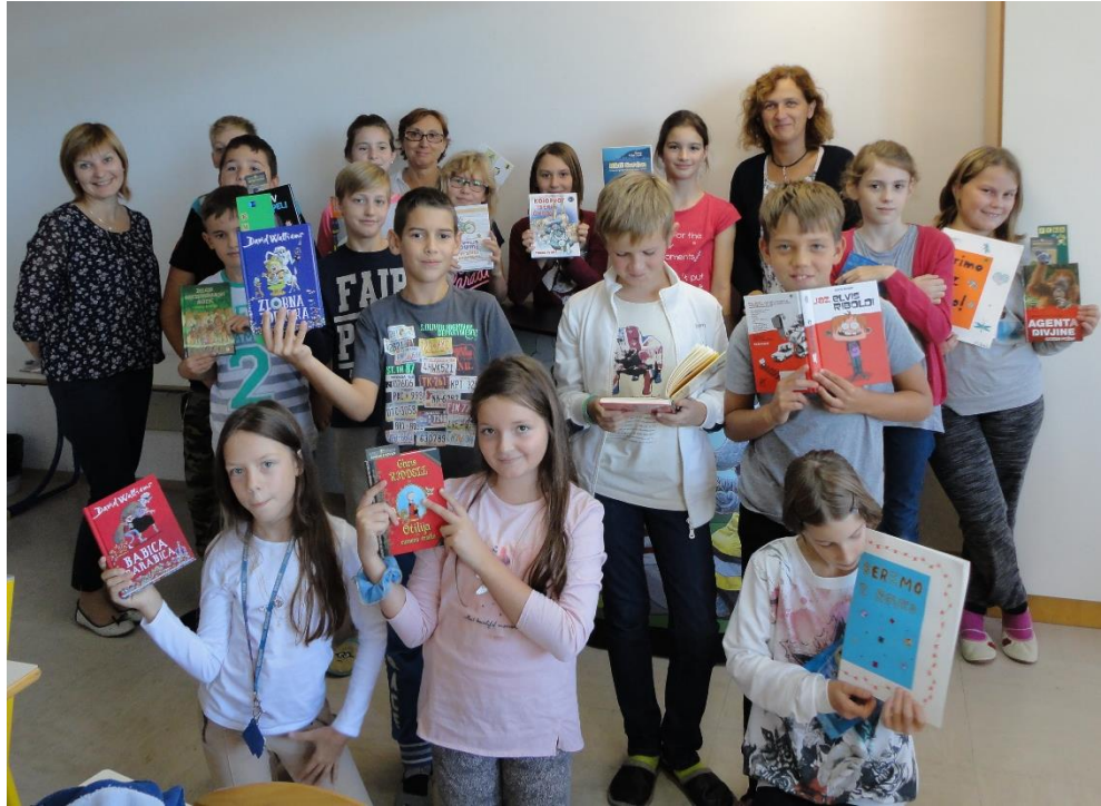
Učenci 5. c razreda z mentoricama in gospo ravnateljico.