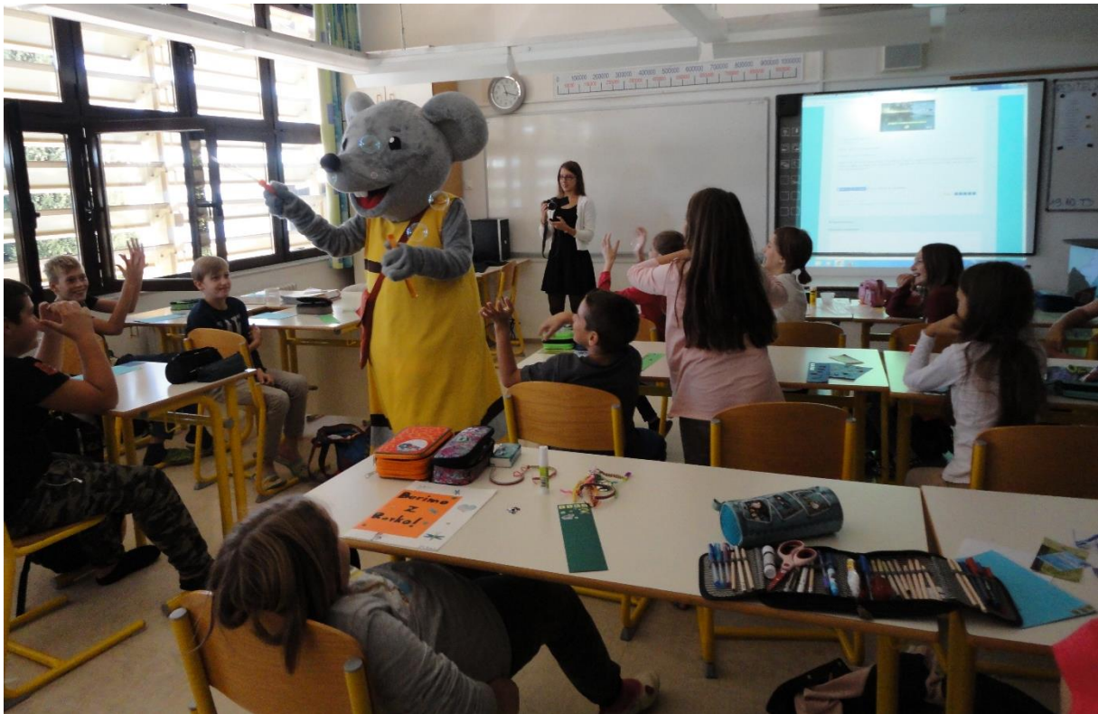
Rovka med nami